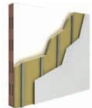
Controparete ad orditura metallica vincolata alla muratura esistente