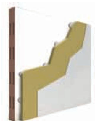
Controparete con Isolastra incollata alla muratura esistente