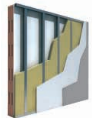
Controparete ad orditura metallica autoportante